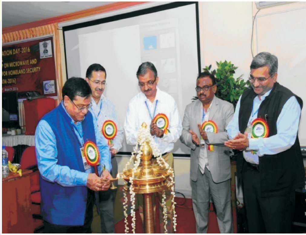
वार्षिक स्थापना दिवस 2016 तथा एनडब्ल्यूएमटीएम 2016 का उद्घाटन समारोह